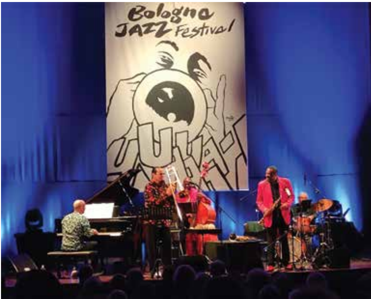
McCoy Legends (SteveTurre trombone, Chico Freeman sax tenore e soprano, Antonio Faraò pianoforte, Ignacio Berroa batteria) - Unipol Auditorium, Bologna Jazz Festival 2024