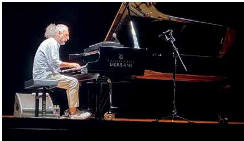
Stefano Bollani solo, Teatro delle Muse, Ancona Jazz Summer 2025